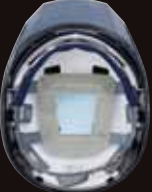
MX内装 メッシュ・ハンモック